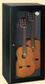
ギター2本用保管庫

本社 Tel: 045-841-5511 又は ホームページ よりお問い合わせください。