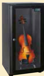
ヴァイオリン保管庫