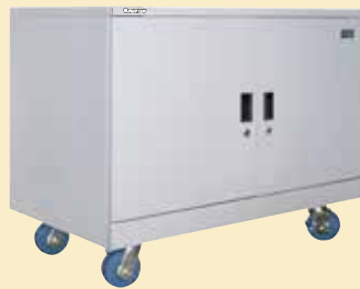
古文書・絵画などの保管庫