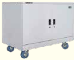
FD-502F1 古文書・絵画などの保管