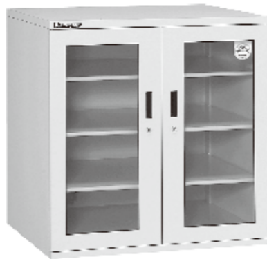
オートドライ(ED-502-10) 商品番号SSTY-032 275,880円(本体価格250,800円)