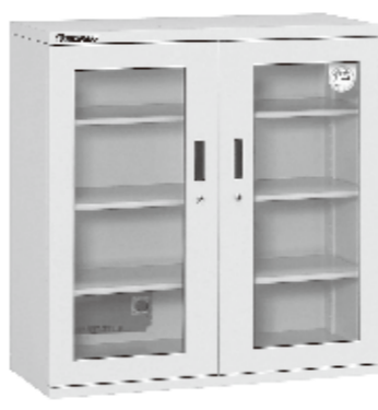
オートドライ(ED-262-10) 商品番号SSTY-031 191,180円(本体価格173,800円)