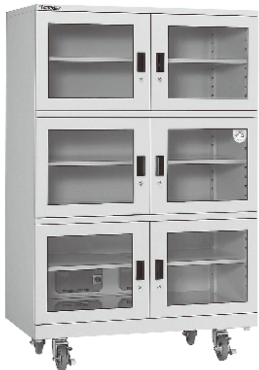
オートドライ(ED-1206-10) 商品番号SSTY-033 465,300円(本体価格423,000円)

中型・大型シリーズは高性能(低湿性能・省エネ・耐久性抜群)と高コストパフォーマンスを両立した業務用の大容量キャビネットです。湿度設定はダイヤル調節式で、最適な湿度(10~50%RH)に任意設定可能。また、中央支柱を取り外すことができるので横長の保管物も収納可能です。