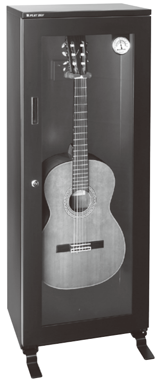
製造元/東洋リビング株式会社